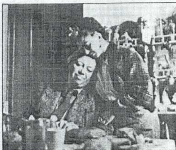
Parte del acervo expuesto.

tante: los caricaturistas. Audifred, Rius, Quezada, El Fgón , hasta un palomazo de Carlos Fuentes (sí, el escritor), todos presentes para narrar la ciudad.